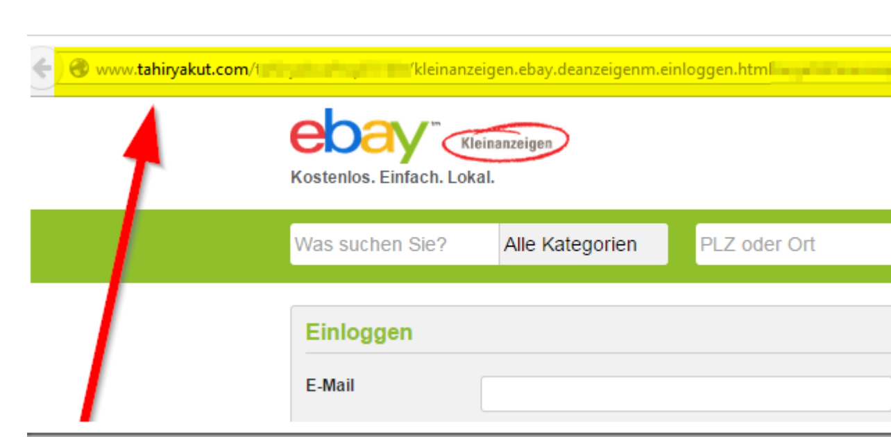
Abb. 2: Beispiel einer gefälschten eBay-Seite