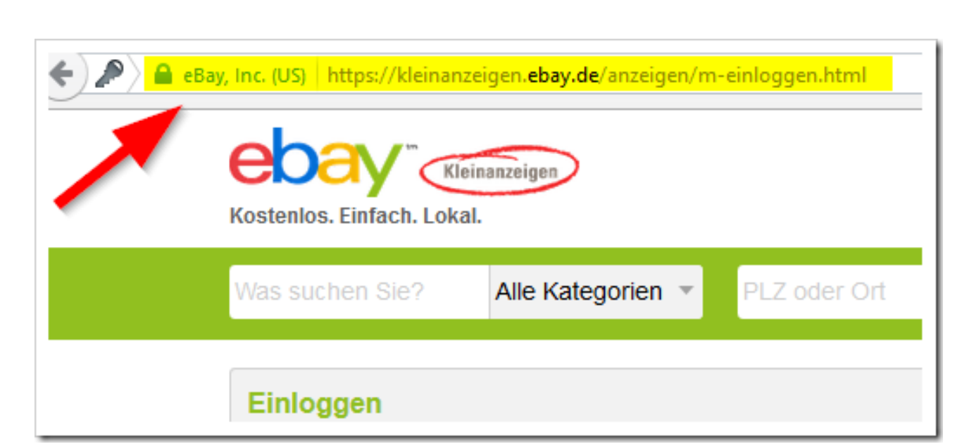
Abb. 4: Adresse der echten eBay-Seite